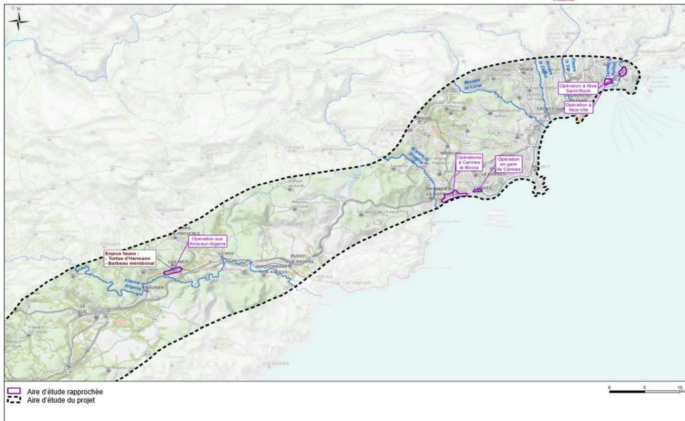
Figure 6 : Synthèse des principaux enjeux d'intérêt communautaire (Directives Habitats-Faune-Flore et Oiseaux). 2/2 planches